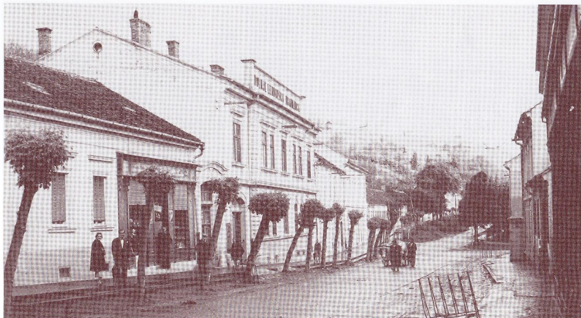
Fotografija zgoraj: Lendava, Glavna ulica, levo zgradba Dolnjelendavskr hranilnice, pred 1941 (razglednica).